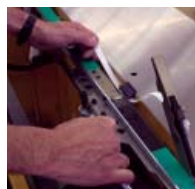
Manutenzione senza utensili