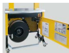
Costruzione robusta e compatta