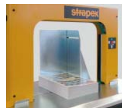
Arresto pacchi per posizionamento preciso di pacchi sciolti