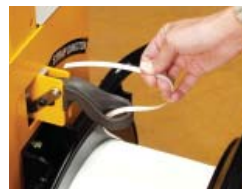
Sostituzione facile e veloce della bobina