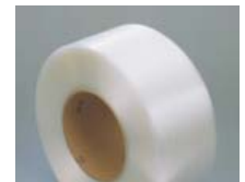
Reggie economiche per una reggiatura delicata